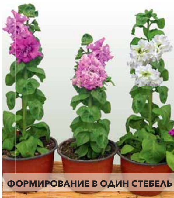
ФОРМИРОВАНИЕ В ОДИН СТЕБЕЛЬ

Первая махровая крупноцветковая петуния для срезки – результат работы итальянских селекционеров по совету «Агрофирмы Ээлита». Разнообразие оттенков, 100%-ная махровость, крупный размер цветков – все это делает нашу красавицу очень привлекательной. А то, что срезанные цветы стоят в вазе 2-3 недели и распускают все бутоны – просто исключительной петунией! В смеси присутствует большой процент белых махровых цветков. Растения прямостоячие, с длинными толстыми стеблями. Если гибрид формировать в один стебель, то получится шикарная петуния на срезку (никакие другие махровые петунии невозможно использовать как срезочные). Если растения не формировать, то вырастет кустовая махровая петуния, которая будет смотреться пышно в садовых контейнерах и на клумбах.