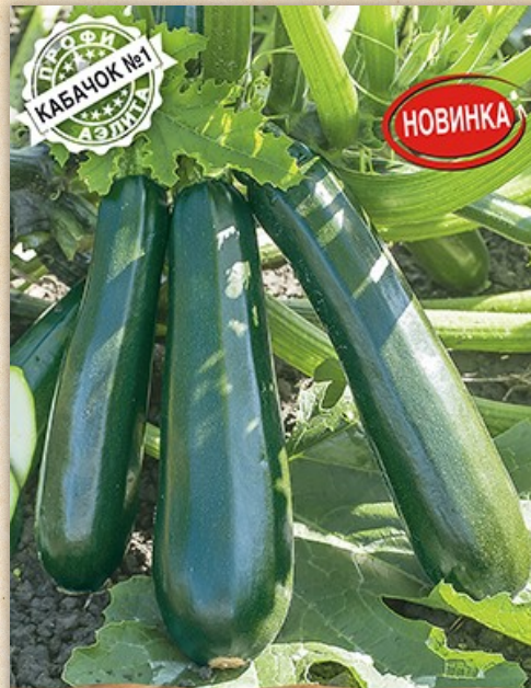
Кабачок Будулай F1

АЭЛИТА ГАРАНТИЯ КАЧЕСТВА Ранний и высокий урожай. Толстостенные плоды-гиганты!