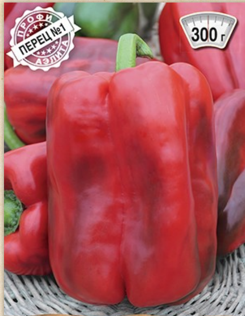
перец сладкий Размер XXL F1

АЭЛИТА ГАРАНТИЯ КАЧЕСТВА Скороспелый сорт. Вкусная, сладкая, сочная мякоть.