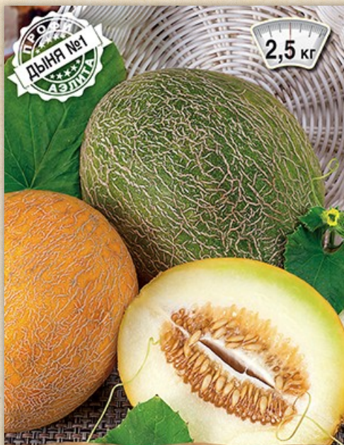
дыня Ранняя 133

АЭЛИТА ГАРАНТИЯ КАЧЕСТВА Скороспелый сорт. Вкусная, сладкая, сочная мякоть.