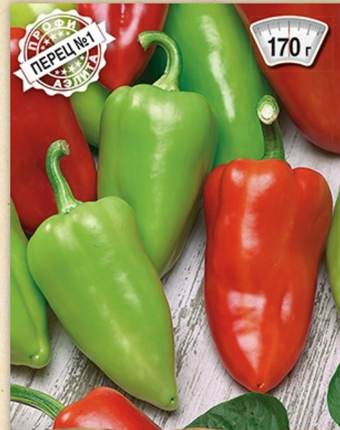
перец сладкий Экспресс-18 F1

АЭЛИТА ГАРАНТИЯ КАЧЕСТВА Высокопродуктивный цуккини. Плоды превосходного качества.