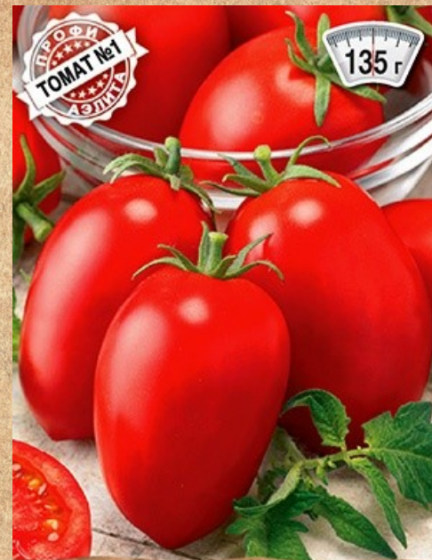
томат детерминантный Биг Рио-88 F1

Сверхпродуктивный, среднеспелый гибрид с округлыми плодами великолепного вкуса. Для теплиц и открытого грунта.