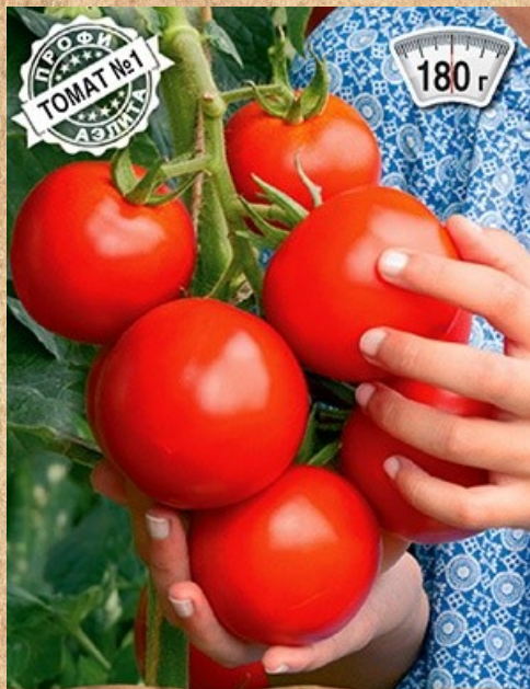
томат индетерминантный Аэлита-71 F1

Гибрид с плотной мякотью и с насыщенным «томатным» вкусом. Толерантен к болезням культуры. Плоды-сливки ярко-красного цвета, массой 100-130 гр.