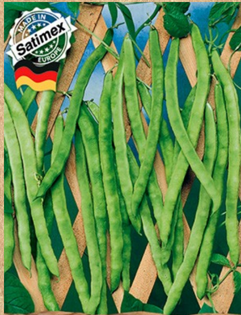
фасоль вьющаяся Некарская королева

Один из самых урожайных, раннеспелых гибридов редиса с уникальной пластичностью и стрессоустойчивостью.