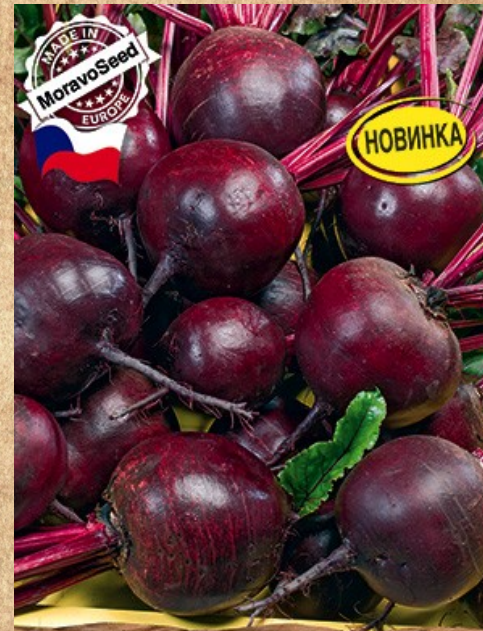
свекла столовая Бона

Спаржевая, высокоурожайная фасоль немецкой селекции. Великолепно смотрится при оформлении арок, беседок и пергол.