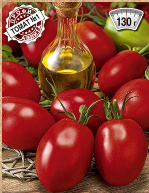
томат детерминантный Север-81 F1