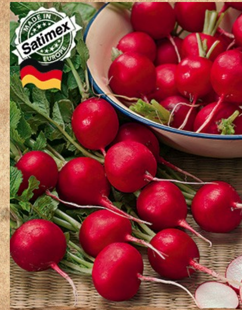
редис Тореро F1

Высокопродуктивный сорт свеклы чешской селекции, позволяет получить стабильный урожай в различных зонах выращивания.