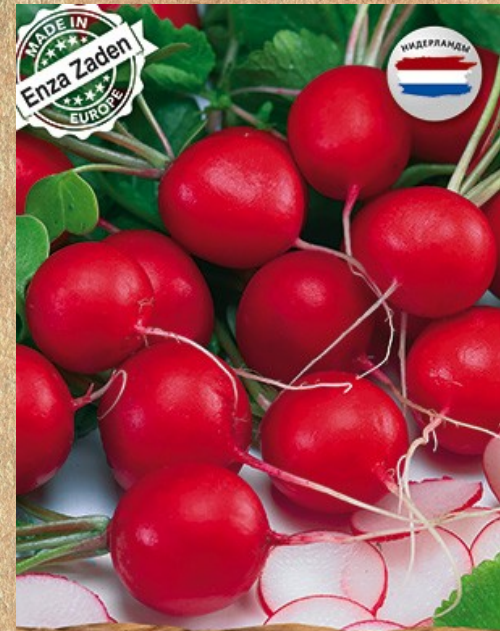
редис Селеста F1